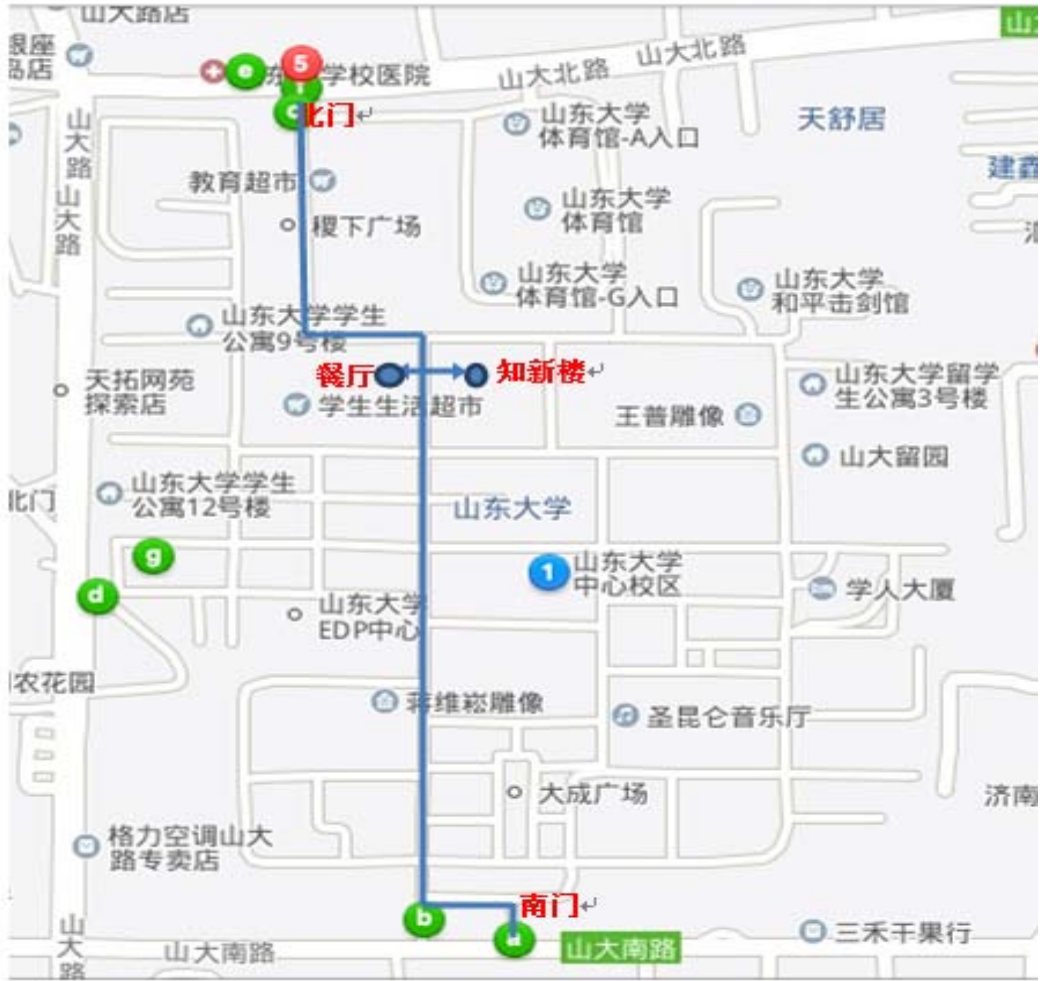
山东大学会场示意图（山东大学中心校区知新楼 A 座）